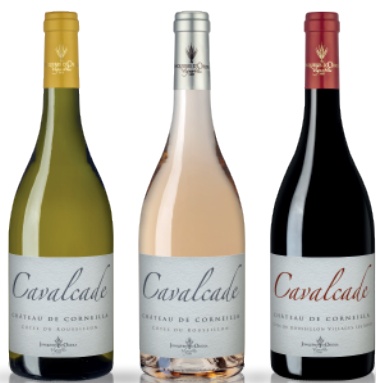
CHÂTEAU DE CORNEILLA GAMME CAVALCADE