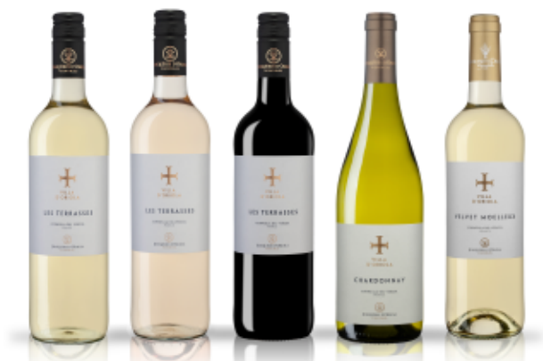
GAMME VILLA D'ORIOLA

Température de Service : 10°C Garde : 3 ans - À boire dans sa jeunesse Accords mets et vins : Foie Gras, Fromages affinés, poêlée de Saint-Jacques et tarte aux poires